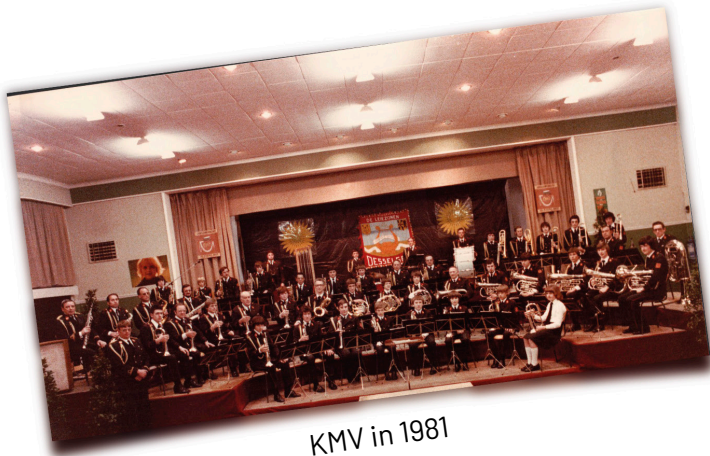
KMV in 1981