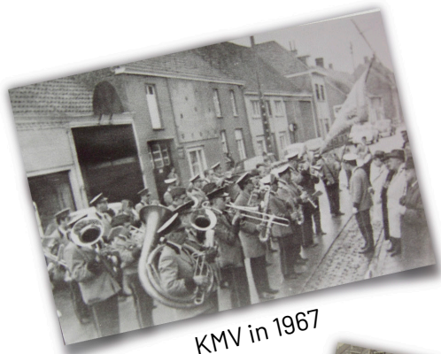
KMV in 1967