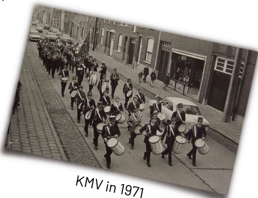
KMV in 1971